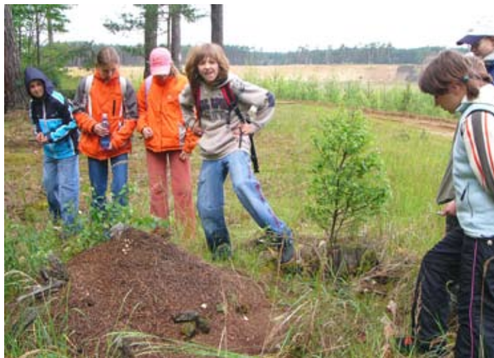
Z exkurze Poušť a řeka.

V roce 2007 tvořily terénní exkurze významnou část činnosti střediska ve vegetační sezóně, zejména v květnu a červnu. Jako tradičně se přihlásila celá řada zájemců o květnaté louky Bílých Karpat a tamní orchideje. Mezi velmi oblíbené exkurze v naší nabídce však patří i Poušť a řeka – návštěva stepní NPP Váté pisky a nedaleké PP Osypané břehy. Dále jsme realizovali řadu návštěv slepého ramene u Kněžpole (Kněž-