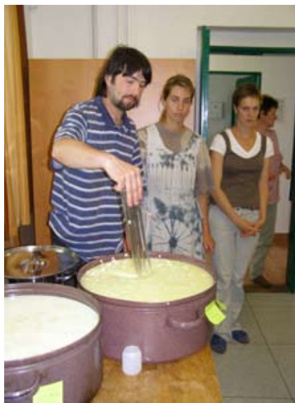
Účastníci kurzu pomáhali při zpracování mléka.

Na terénní stanici Správy CHKO Bílé Karpaty v Hrubé Vrbce se o víkendu 16. - 17. června konal