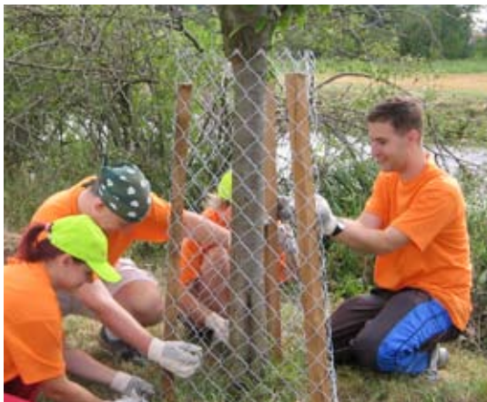
Dobrovolníci zabezpečili třešně ochranným pletivem proti bobrům.

V posledních letech narostla populace bobra evropského na Baťově kanále natolik, že celá řada stromů v okolí toku uschla v důsledku ohryzu. Aby podobně neskončily také vysazené třešně, snažili jsme