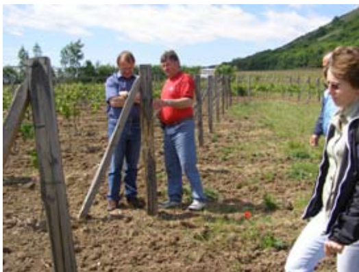
Vinařská exkurze na Pálavu.

Exkurze do ekovinařství rodiny Abrlovy z Pavlova se uskutečnila 12. května. Abrlovi s úspěchem pěstují klasické odrůdy vinné révy bez použití škodlivých postřiků a umě-