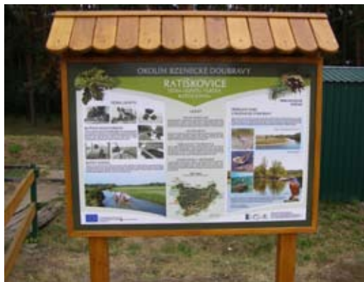
V okolí Bzenecké Doubravy byly rozmístěny informační panely.

Cílem projektu bylo především zvýšit informovanost obyvatel v okolí Ptačí oblasti Bzenecká