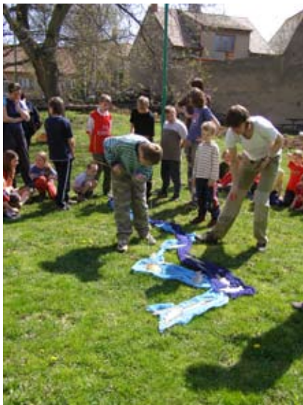
Oblíbenou aktivitou bývá lovení ryb.

Dne 23. července se všechny děti z letního tábora Littner zúčastnily výukového programu Život v řece Moravě. V jeho průběhu se hravou formou seznámily se základními zeměpisnými údaji řeky Moravy,