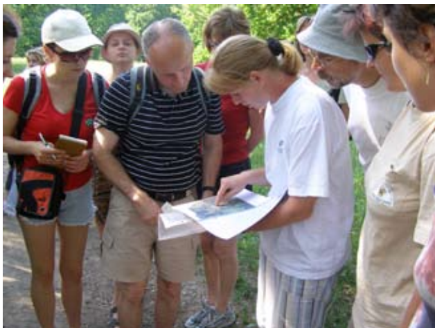
Exkurze pro koordinátory EVVO v NPR Čertoryje.

Spolu se Školským vzdělávacím střediskem Lipka z Brna se naše středisko podílelo na organizaci a lektorování semináře pro pedagogy Jihomoravského kraje. Kromě pomoci s organizačním zajištěním bylo naším úkolem seznámit účastníky několika-